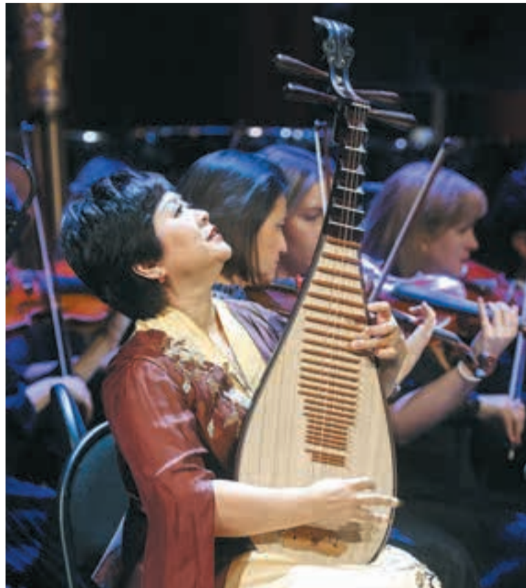
В этом году красноярцы открыли для себя китайский инструмент пипу