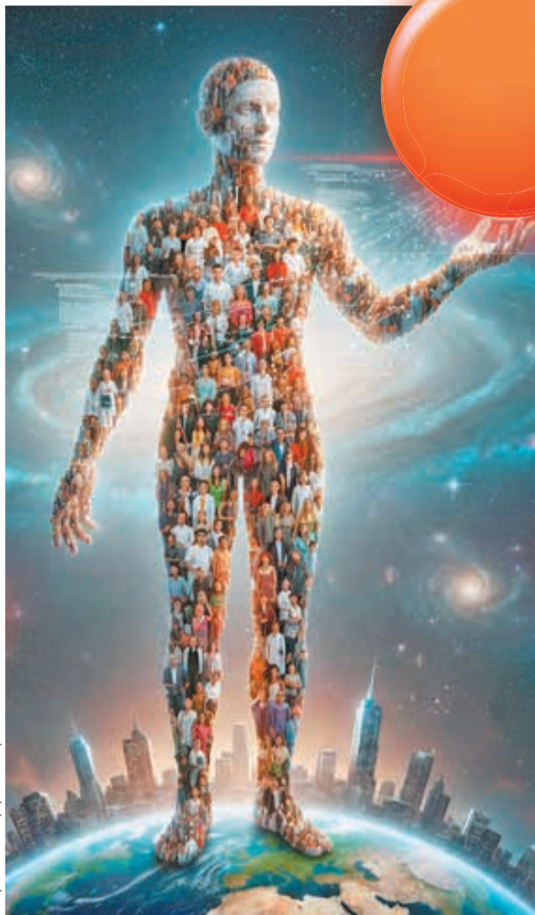
Изображение сгенерировано нейросетью

Отдельный вопрос: зачем непальское правительство решило отлучить народ от соцсетей? Утверждают, например,