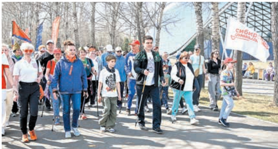
В апреле 2025-го был дан старт массовому региональному движению «Сибирское долголетие». Вместе с красноярцами губернатор принял участие в первом мероприятии проекта ■