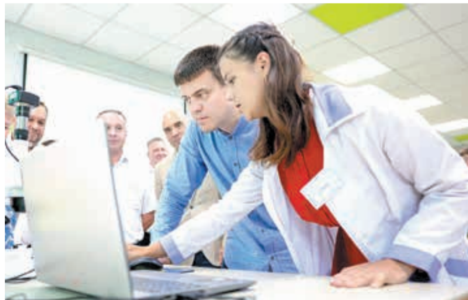
Поддержка аграрного сектора – в числе приоритетов края. Вопросы развития сельского хозяйства, подготовки кадров губернатор обсуждает в том числе со специалистами отрасли ■