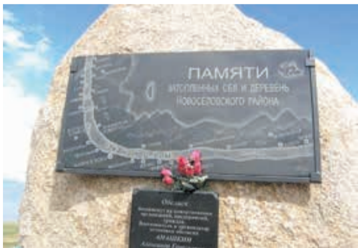
На берегах Красноярского моря в память затопленных деревень устанавливают информационные камни ■

– В тот день я проехал на велосипеде около 80 км и прибыл на место, где, в соответствии с лоциями, должно было находиться бывшее село Красноуранское, возникшее из Абаканского острога, – рассказывает путешественник. – Вечером в полной темноте среди ледяных торосов я наконец нашел это место: подо мной, на глубине 22 метров, находилась 300-летняя история, 15 поколений людей! Настолько сильное было чувство, что выбило слезу.