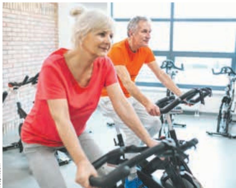
Велотренажер позволяет тренироваться индивидуально, в комфортных домашних условиях и постоянно ■