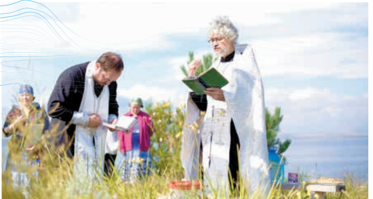
Священники Дивногорска служат молебны на местах, где раньше стояли деревни и под воду ушли погосты ■

Музей уже практически готов к приему посетителей и начнет работу в следующем году.