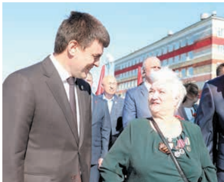
Глава края всегда отмечает, что встречи с ветеранами вдохновляют его работать еще активнее ■

– Наше движение «Сибирское долголетие» – для всех, у кого горит в душе огонь, независимо от цифр в паспорте. Будет много новых идей,