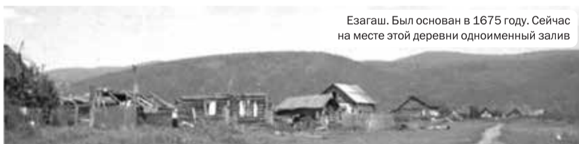
Езагаш. Был основан в 1675 году. Сейчас на месте этой деревни одноименный залив

В зону затопления попадали 132 населенных пункта, среди которых были три райцентра: села Даурское, Новоселово и Краснотуранское. Переселению подлежало 60 тысяч человек. Поскольку большая часть Даурского района оказалась затопленной, он был упразднен, а его территория вошла в состав Балахтинского.