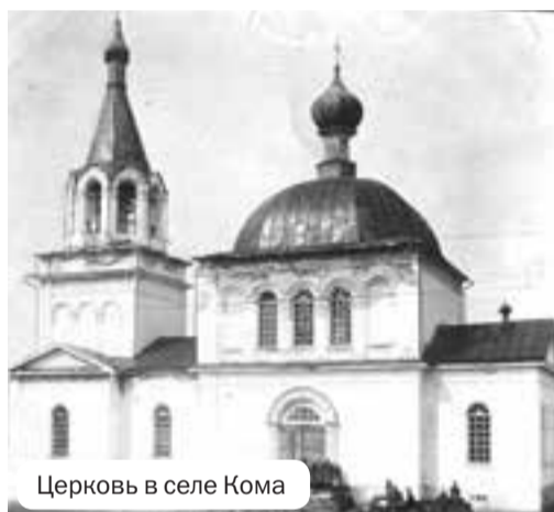
Церковь в селе Кома