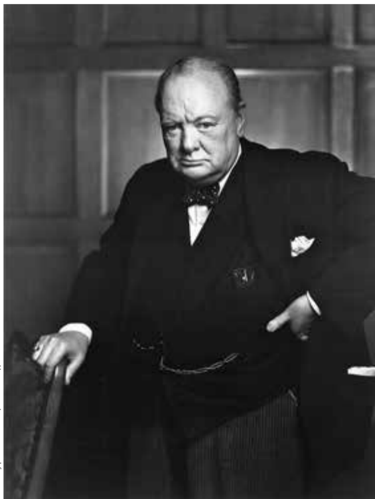
Сэр Уинстон Черчилль, 1941 г. ■

В нынешней ситуации как-то не совсем привычно, когда наш искренний недруг говорит как «кремлевский пропагандист», но это так, и это совсем не тайна и никогда ею не было. «Агрессия» СССР встречена Британией с полным пониманием, даже сочувствием. Более того, именно Черчиллю принадлежит честь изобретения исторического термина «Восточный фронт», который станет полной реальностью че-