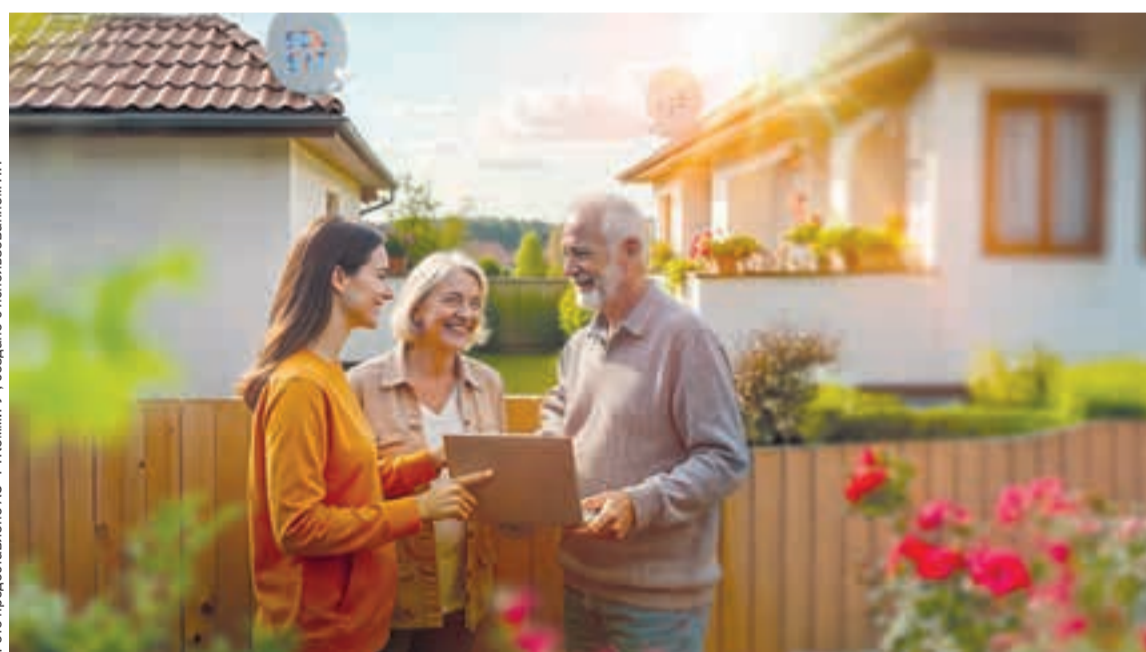
Фото предоставлено АО «РТКОММ.РУ», создано с использованием ИИ

Соседям для подключения к интернету необходимо заключить договор с оператором, приобрести по специальной цене от 1200 руб. маршрутизатор 6 и выбрать подходящий тариф